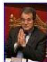
Corriere della Sera

La Repubblica - 3 ore fa ROMA - "La Bicamerale è la strada per le riforme". Era il 7 gennaio 1997. La commissione per le riforme presieduta da D'Alema si stava per insediare. E Romano Prodi dava il suo placet. A dieci anni di distanza la scena si ripete. ... Prodi: "Nessuno ha mai parlato di bicamerale"