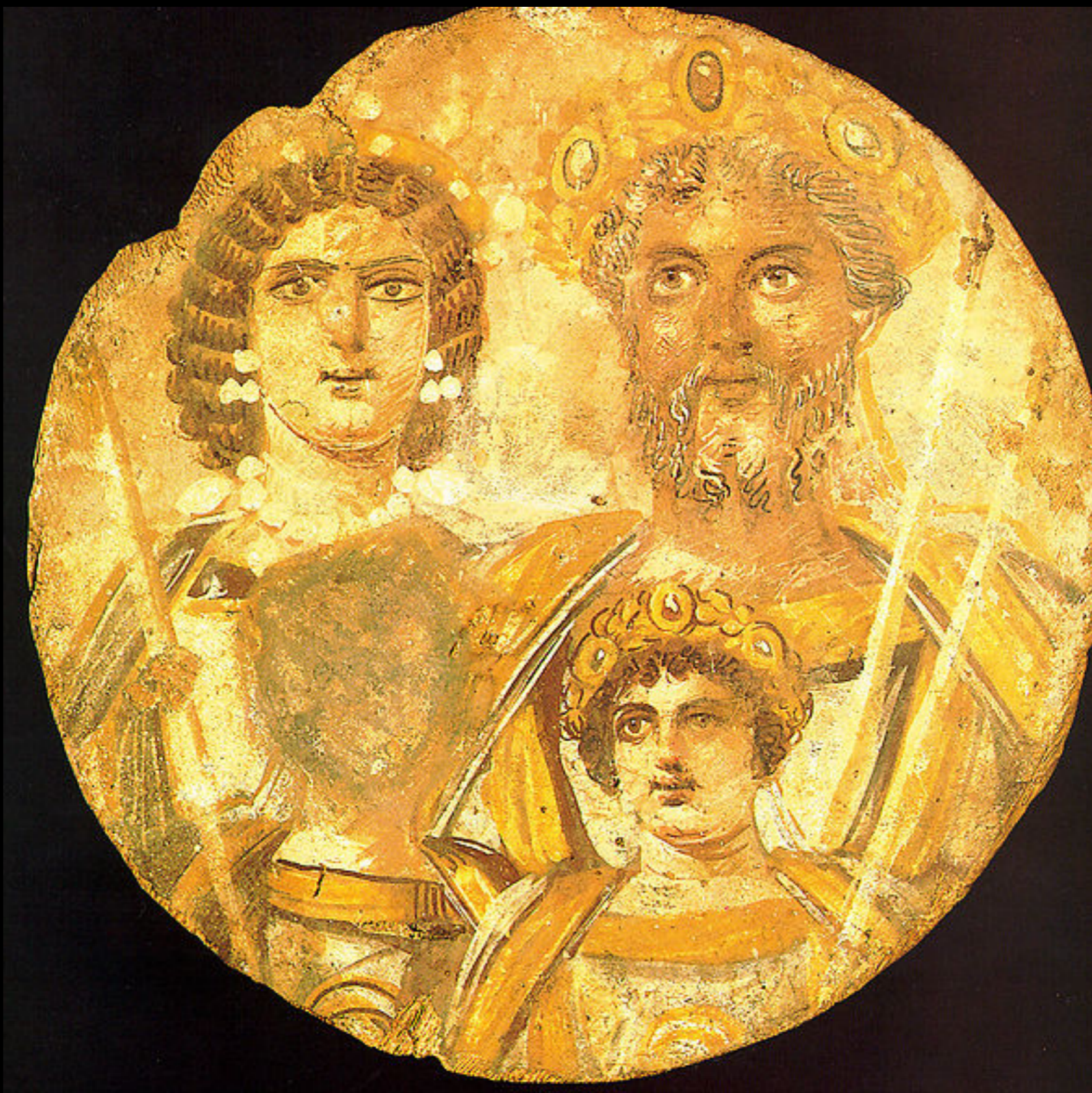
Caracalla dispone la damnatio memoriae del fratello Geta dal tondo severiano